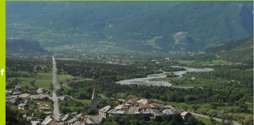
Village en escargot de Saint-Crépin

Cet itinéraire est aménagé en sentier d'interprétation. Des panneaux illustrés vous permettront de découvrir l'un des plus importants peuplements de Genévriers Thurifères d'Europe, une forêt unique, et des arbres très originaux. Une fois votre balade terminée, la visite du village de Saint-Crépin au patrimoine architectural et vernaculaire si riche mérite de prendre un moment.